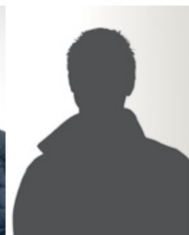
Nieuwe collega Wij zoeken jou!