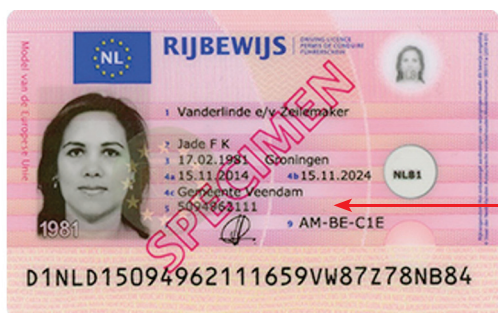
Rijbewijsnummer Bij punt 5